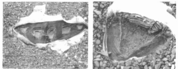
图 3 唐山中心垃圾填埋场典型的施工破损孔洞

对比国内外的统计资料，虽然唐山中心垃圾填埋场的施工质量比较好，但通过对其 84 000 m 2 的场底的渗漏检测，总共发现 19 个破损孔洞 [4] 。图 3 为典型的破损孔洞。